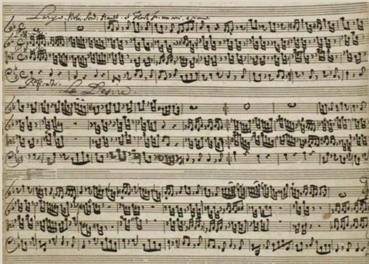
CHRISTOPH GRAUPNER (1683–1760): AUTOGRAPH VON „LE DESIRE“ (LARGO) AUS DER OUVERTURE IN F-DUR GWV 445