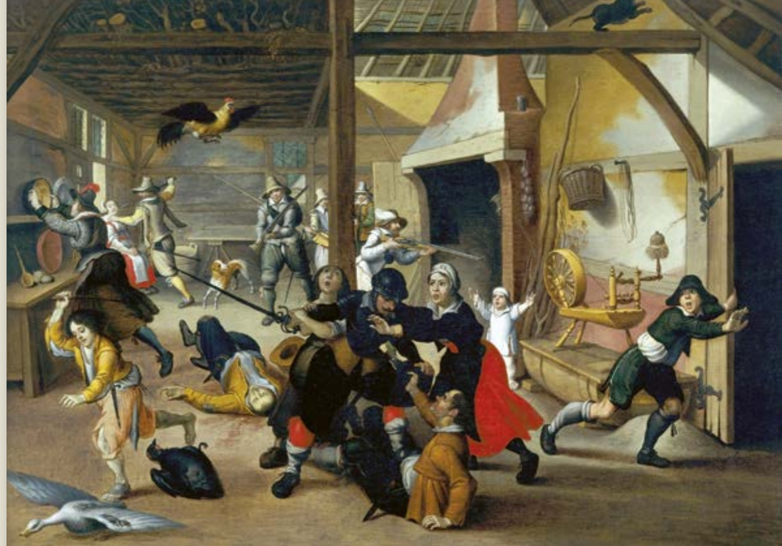
Sebastian Vrancx (1573–1647): Soldaten plündern einen Bauernhof (1620) 1. Deutsches Historisches Museum 2. The Bridgeman Art Library, Objekt 292256, Gemeinfrei, wikimedia

O, du Gott des Friedens, gönne uns doch wieder deinen himmlischen Frieden! Lass Kirchen und Schulen nit zerstöret, lass den Gottesdienst und gute Ordnung nicht vertilget werden. Hilf uns, mit deinem ausgestreckten Arm, beschere uns ein Örtlein, da wir bleiben, ein Hüttlein, darinne wir uns aufhalten, ein Räumlein, da wir sicher sein und deinem Namen dienen können. Dass wir in Friede deinen Tempel besuchen, in Friede dich loben und preisen, in Friede selig sterben mögen.