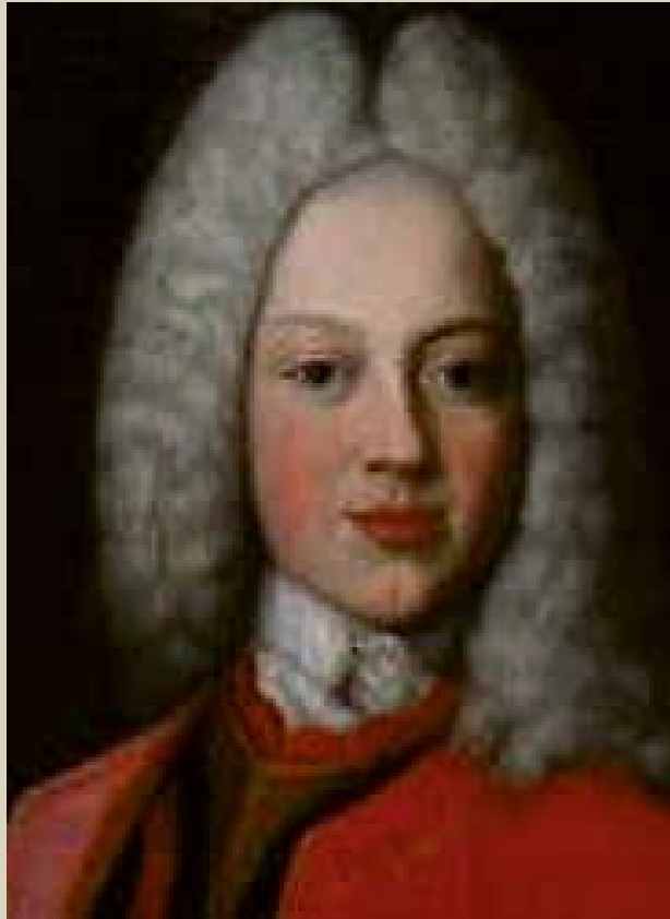
Philipp Heinrich Erlebach: ru.wikipedia.org/w/index.php?curid=7560655