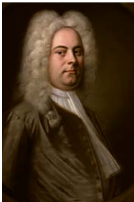
George Frideric Handel Balthasar Denner (1685–1749) zugeschrieben, entstanden ca. 1726 bis 1728

Bass for the Harpsichord or Violoncello“ diente offenbar der besseren Verkäuflichkeit. In Liebhaberkreisen konnte der Generalbass wahlweise von einem Cembalisten oder einem Cellisten ausgeführt werden, doch war es (anders als in Deutschland) in London seit den 1720er Jahren üblich, zumindest unter professionellen Kammermusikern, den Basso continuo doppelt zu besetzen: mit einem Melodie- und einem Akkordinstrument. Freilich kann es in der Rückschau, auch aus der „historisch informierten“ Perspektive, nie um richtig oder falsch gehen. Wie der Continuo zu realisieren sei, hing von allerhand Umständen ab, dem Werk, dem Ensemble, den Räumlichkeiten, und deshalb konnten von der Orgel bis zur Erzlaute und vom Fagott bis zum Violone die verschiedensten Mitstreiter rekrutiert und kombiniert werden.